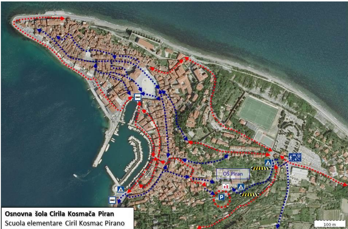
Osnovna šola Cirila Kosmača Piran Scuola elementare Ciril Kosmac Pirano