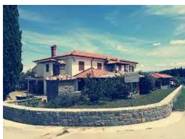
Moja in Brinina hiša.