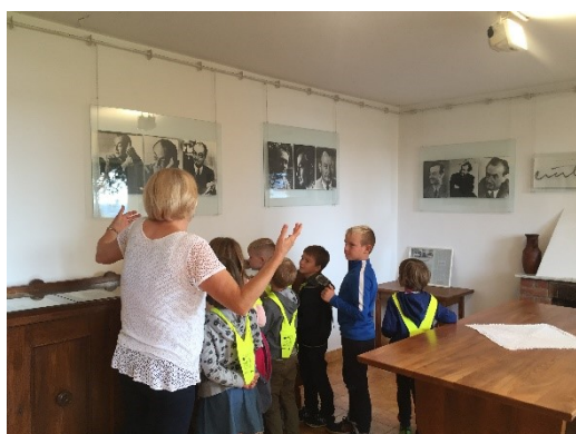
Učenci Podružnične šole so obiskali Kosmačevo hišo in izvedeli veliko o pisatelju, po katerem nosi ime naša šola. V sklopu projekta »Kako čudovit je ta svet« so učenci 4. b pisali obvestila in obveščali krajanе o njihovi zbiralni akciji starega papirja in plastičnih zamaškov.