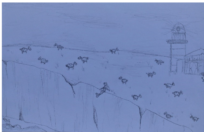
Ajda Levac (Mate Dolenc, Morska deklica z otočja Shetland)