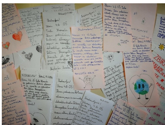
Obvestila krajanom.