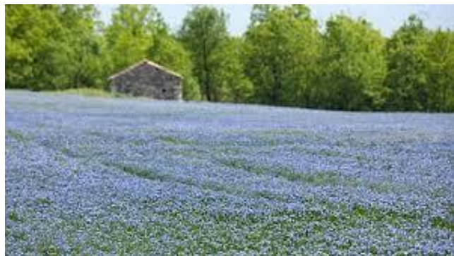
Tako je videti laneno polje.

Iz lanu izdelujejo lanena vlakna, ki jih nato stekajo v zelo močno tkanino. Danes iz lanu izdelujejo tudi kirurške niti.