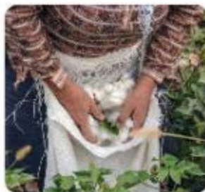
Ročno obiranje bombaža

V zadnjih letih je v porastu pridelava in predelava ekološkega bombaža. Takšno blago ne vsebuje nevarnih kemikalij, je zračno ter neškodljivo in primerno tudi za občutljivo kožo.