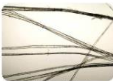
Lanena vlakna so pod mikroskopom videti kot slamica z vidnimi koleni.