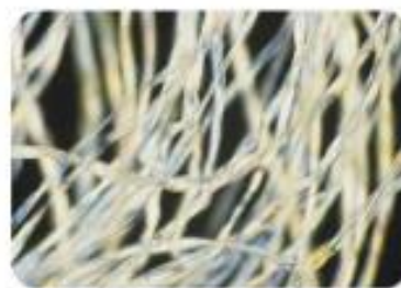
Pod mikroskopom so bombažna vlakna videti kot zviti trakovi.