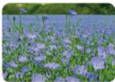
Polje cvetočega lanu

V Sloveniji so v preteklosti lan pridelovali v Beli krajini. Danes ohranjajo pridelavo in predelavo lanu v turistične namene.