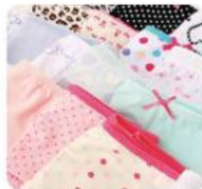
Bombažna vlakna prenesejo pranje ob visoki temperaturi, zato iz njih izdelujejo blago za spodnje perilo.