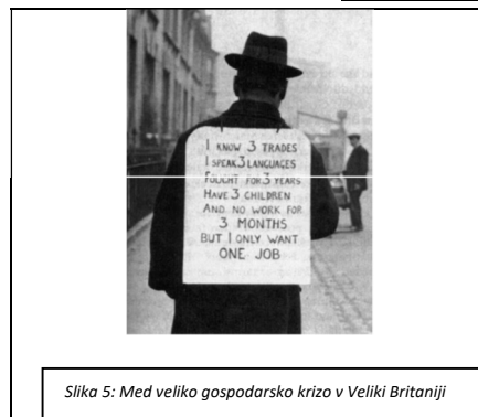
Slika 5: Med veliko gospodarsko krizo v Veliki Britaniji