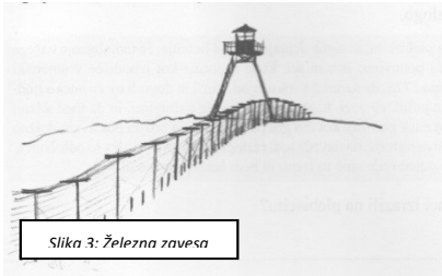
Slika 3: Železna zavesa