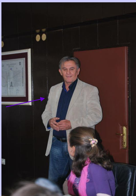
ŽUPAN OBČINE GROCKA